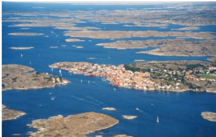
Årets studieresa med Ingenjörer och Läkare för Miljön